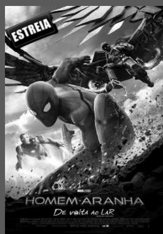
HOMEM ARANHA DE VOLTA AO LAR